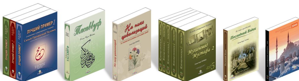
Лучший Пример - 1, 2, 3