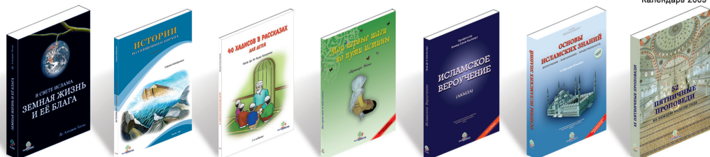
Земная жизнь и её блага